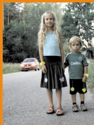
Su atšvaitais diena