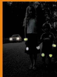
Su atšvaitais naktį