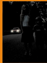
Be atšvaitų naktį